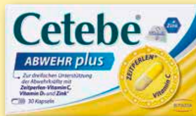
Cetebe ® Abwehr plus Vitamin C + Vitamin D3 + Zink 30 Kapseln statt € 12,49 1)