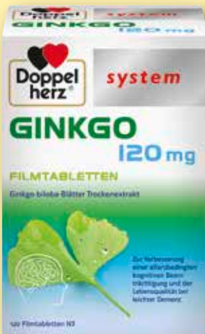
Doppelherz ® system Ginkgo 120 mg 120 Filmtabletten statt € 58,69 1)