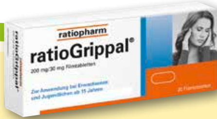
ratioGrippal ® 200 mg/30 mg 20 Filmtabletten statt € 10,48 1)