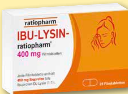
IBU-LYSIN- ratiopharm ® 400 mg 20 Filmtabletten statt € 10,48 1)