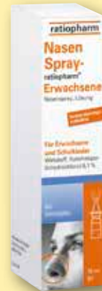
NasenSpray- ratiopharm ® Erwachsene konservierungs- mittelfrei 10 ml