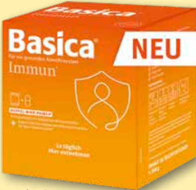
Basica ® Immun 30 Tagesportionen statt € 37,50 1)