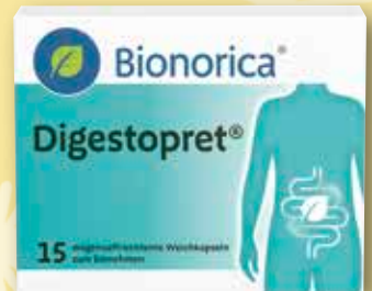
Digestopret ® 15 magensaftresistente Weichkapseln statt € 12,48 1)