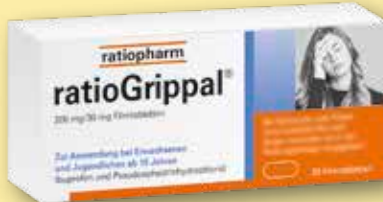
ratioGrippal ® 200 mg/30 mg Filmtabletten 20 Stück statt € 11,50 1)