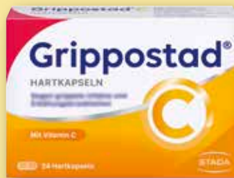
Grippostad ® C Hartkapseln 24 Stück statt € 16,37 1)