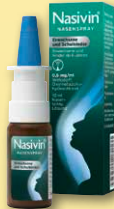
Nasivin ® Nasenspray Erwachsene und Schulkinder 10 ml statt € 7,25 1)