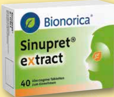
Sinupret ® extract 40 überzogene Tabletten statt € 29,64 1)