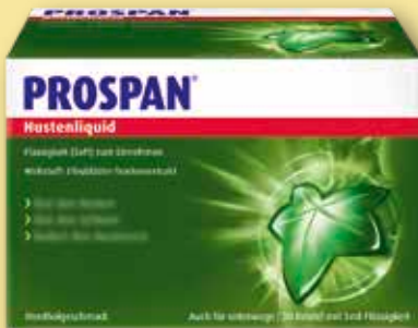
Prospan ® Hustenliquid 30 Beutel mit je 5 ml Flüssigkeit statt € 12,48 1)