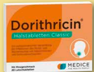
Dorithricin ® Halstabletten Classic 20 Lutschtabletten statt € 12,35 1)