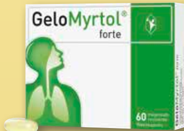
GeloMyrtol ® forte 60 magensaftresistente Weichkapseln statt € 37,50 1)