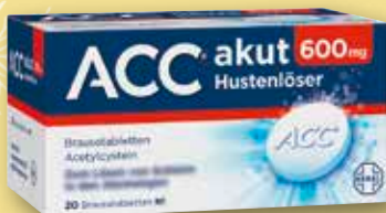
ACC ® akut 600 mg Hustenlöser 20 Brausetabletten statt € 19,11 1)