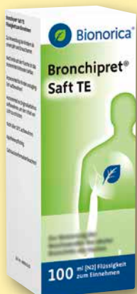
Bronchipret ® Saft TE 100 ml