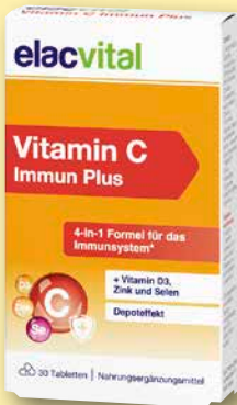
elacvital Vitamin C Immun Plus 30 Stück