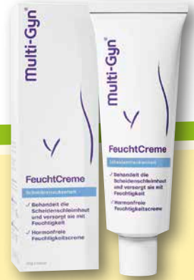
Multi-Gyn ® FeuchtCreme 25 g