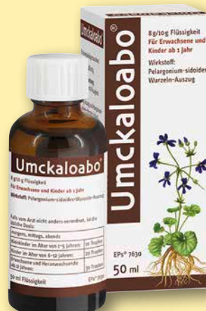
Umckaloabo ® 50 ml

Achten Sie auf weitere Angebote in unserer Apotheke!