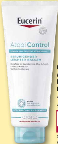
Eucerin ® Atopi Control Beruhigender leichter Balsam 400 ml