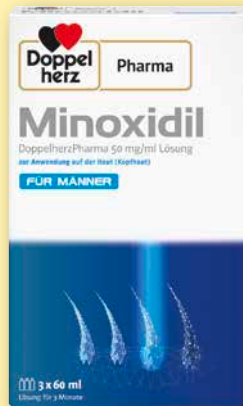
Doppelherz Pharma Minoxidil Für Männer

50 mg/ml Lösung zur Anwendung auf der Kopfhaut 3 x 60 ml