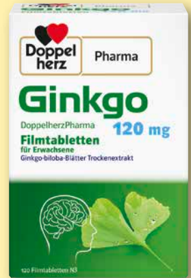
Doppelherz ® Pharma Ginkgo 120 mg 120 Filmtabletten