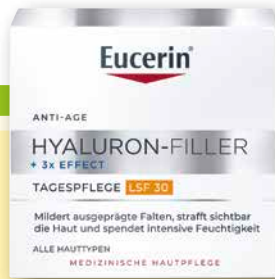
Eucerin ® Anti-Age Hyaluron-Filler Tag LSF 30, 50 ml